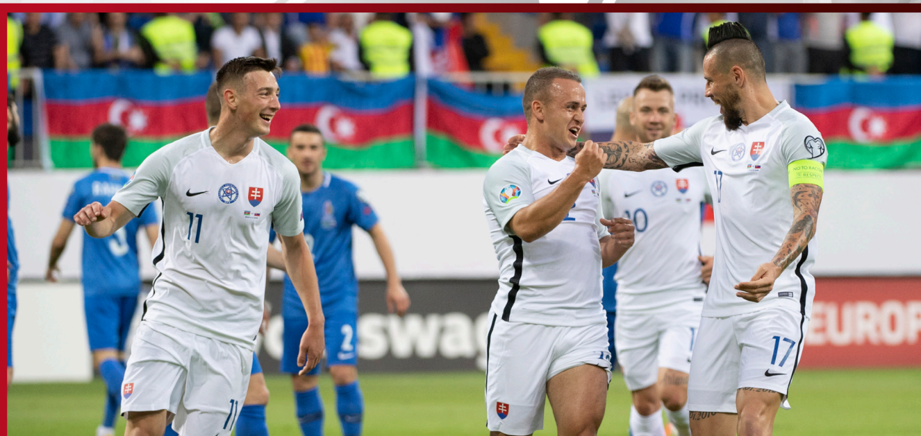
Trio Boženík - Lobotka - Hamšík oslavuje gól v zápase Azerbajdžan - Slovensko 1:5 (11.06.2019).