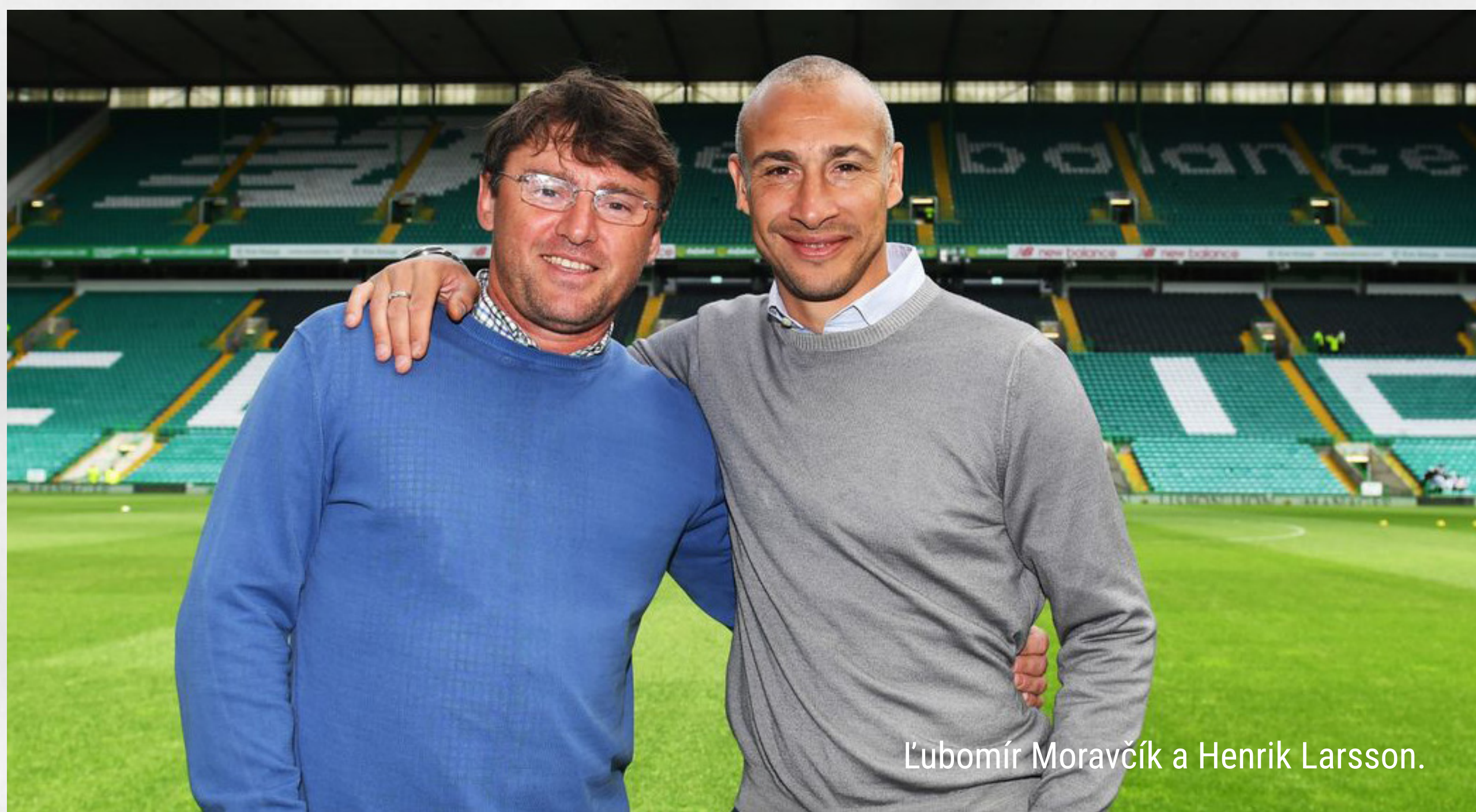
Ľubomír Moravčík a Henrik Larsson.

„Viete, my sme mali kamarátsky vzťah, ale zas sme nejako veľmi nedeбатovali.“