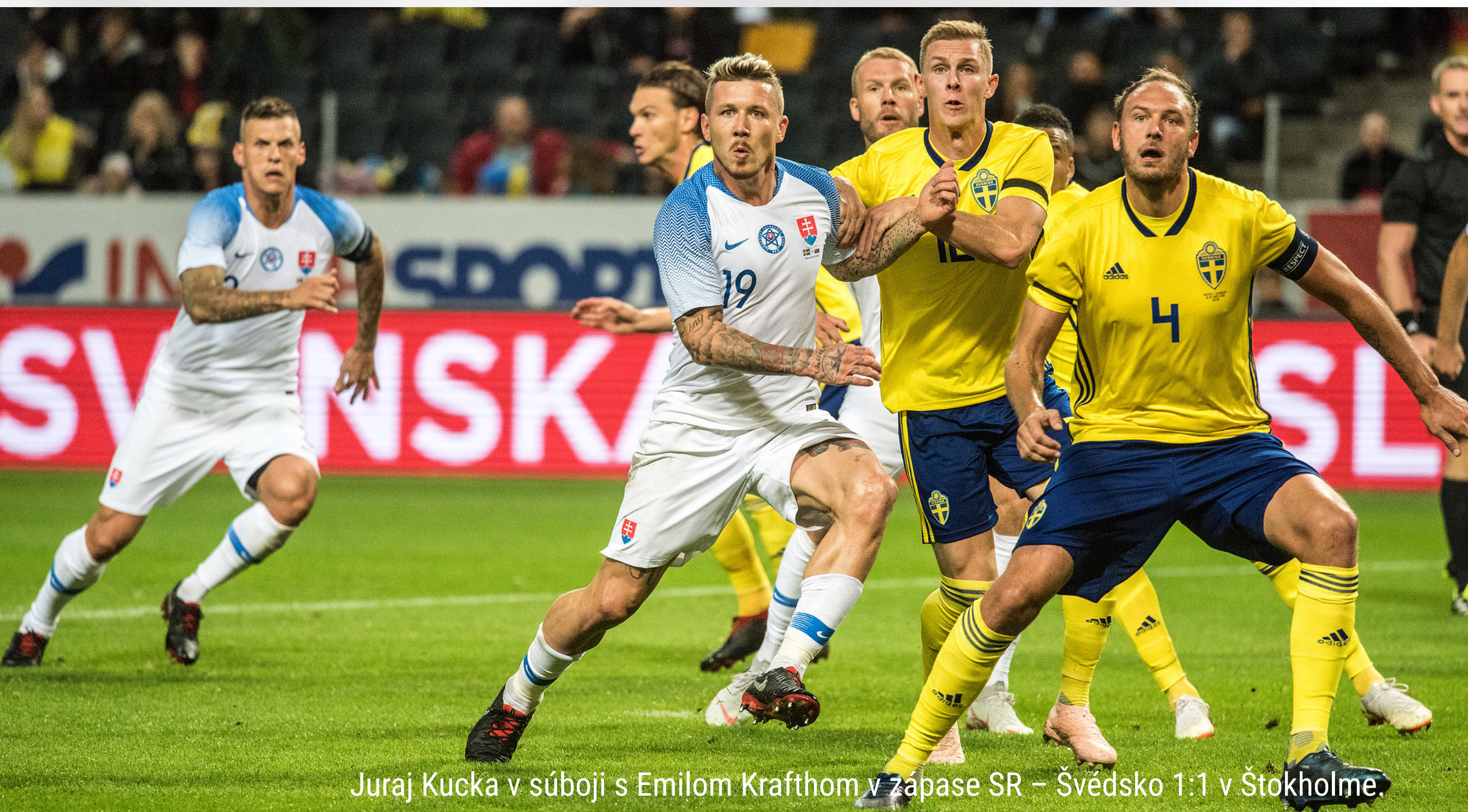
Juraj Kucka v súboji s Emilom Krafthom v zápase SR – Švédsko 1:1 v Štokholme.

V aktuálnom kádri Slovenska figurujú pre dnešný zápas z tohto stretnutia Pekarík, Šatka, Škriniar, Hancko, Hrošovský a Bénes, na strane súpera je to brankár Olsen, Lindelöf, Augustinsson, Krafth, z lavičky náhradníkov zápas sledoval Kulusevski.