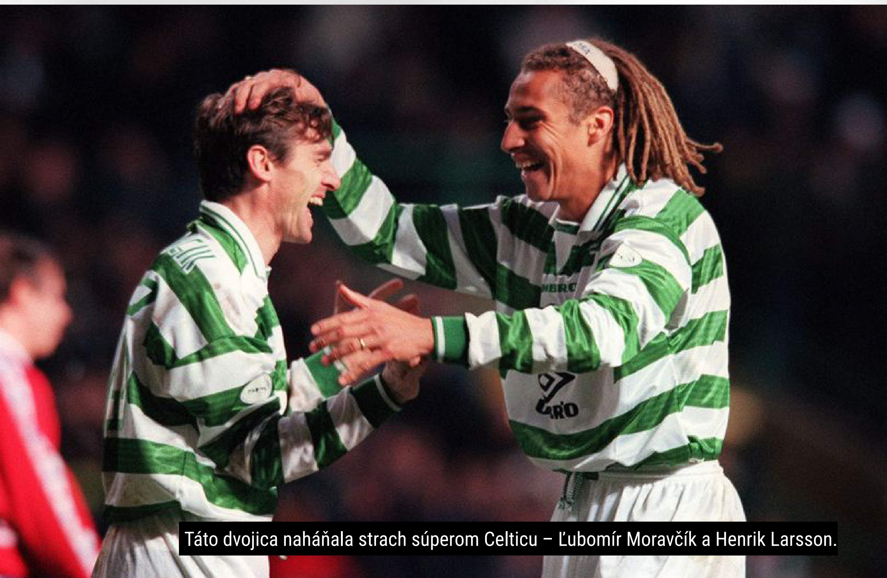
Táto dvojica naháňala strach súperom Celticu – Ľubomír Moravčík a Henrik Larsson.

Pamätáme si, že medzi novinármi vtedy vzbudili jeho slová úžas. Páni, končím... Čo bolo potom? „Viete, neviem, ako to vtedy bolo s mobilmi, taká doba ako dnes asi vtedy nebola. Nepamätám si. Hneď som odletel do Škótska, vtedy sa nám so Celticom darilo. Práve vtedy k nám prišiel kouč Martin O'Neill, išla nám karta.“ Celtic vtedy vyhral tripple, v sezóne 2000/2001 získal titul, Škótsky pohár i škótsky