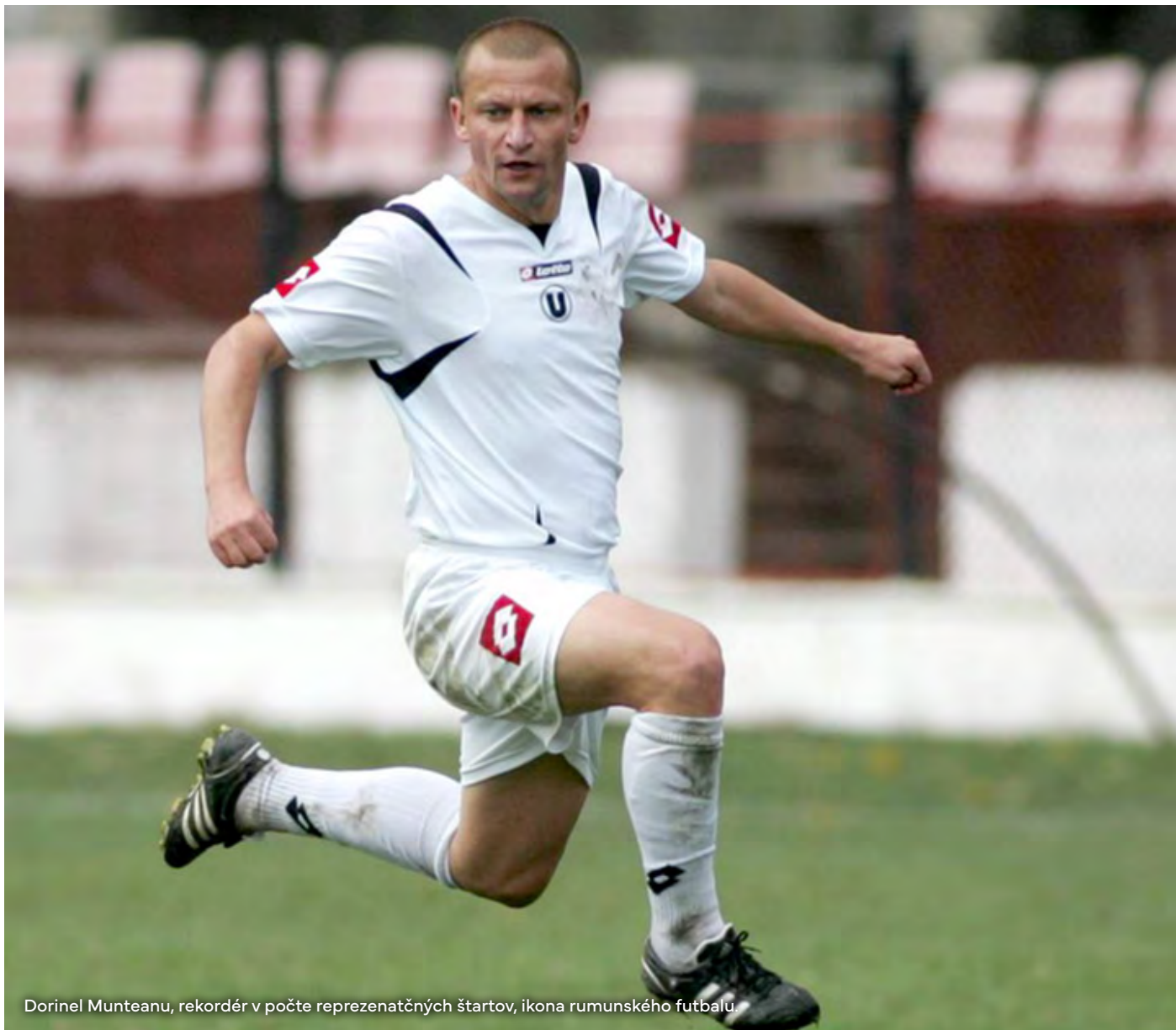
Dorinel Munteanu, rekordér v počte reprezentatčných štartov, ikona rumunského futbalu

35 gólov za národný tím dosiahli Adrian Mutu a Gheorge Hagi, čo je dosiaľ maximum. Mutu má pri 77 medzištátnych štartoch priemer 0,45 gólu na zápas, najlepší priemer má Iuliu Bodola, ktorý reprezentoval 48-krát (v rokoch 1931 až 1939) 0,65 gólu na zápas, strelil 31 gólov.