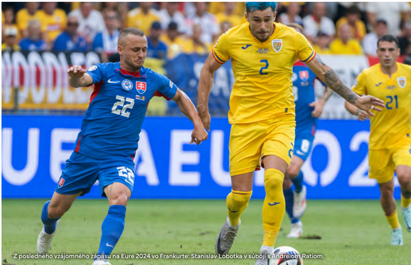
Z posledného vzájomného zápasu na Eure 2024 vo Frankfurt: Stanislav Lobotka v súboji s Andreiom Ratiom.