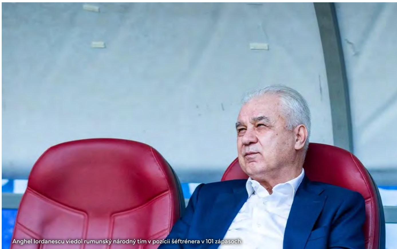
Anghel Iordanescu viedol rumunský národný tím v pozícii šéftrenera v 101 zápasoch.