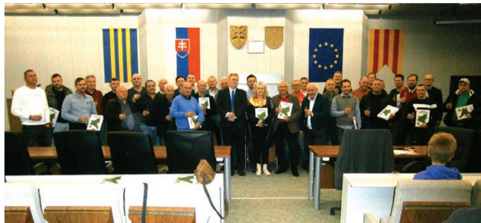
Spoločná fotografia pre históriu z krstu knihy Futbal v okrese Galanta

Publikácia Futbal v okrese Galanta je v predaji na sekretariáte Oblastného futbalového zväzu Galanta, jej cena je 25 €, záujemcovia sa môžu kontaktovať aj telefonicky 0905 734 510, resp. e-mailom obfzga@futbalsz.sk.