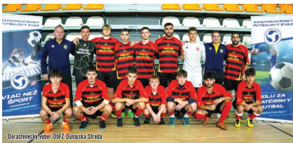
Dorastenecký výber ObFZ Dunajská Streda.

„Máme dve ligy, siedmu a ôsmu, v každej hrá zhodne po šestnásť tímov. Priznám sa, že s obavami sme nazerali v lete na naplnenie krajskej súťaže, naše mužstvá postupujú do VI. ligy Juh, v ktorej hrajú aj kluby Oblastného futbalového zväzu Galanta. Aktuálne máme v tejto súťaži sedem tímov z nášho zväzu. Čo ale chceme vyzdvihnúť, je vysoká úroveň infraštruktúry na štadiónoch v okrese Dunajská Streda. Môžem smelo prehlásiť,