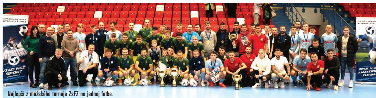
Najlepší z mužského turnaja ZsFZ na jednej fotke.