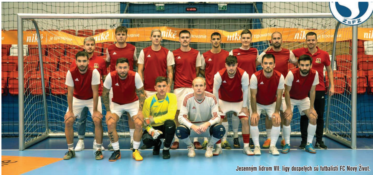
Jesenným lídrom VII. ligy dospelých sú futbalisti FC Nový Život.

„Máme dve ligy, siedmu a ôsmu, v každej hrá zhodne po šestnásť tímov. Priznám sa, že s obavami sme nazerali v lete na naplnenie krajskej súťaže, naše mužstvá postupujú do VI. ligy Juh, v ktorej hrajú aj kluby Oblastného futbalového zväzu Galanta. Aktuálne máme v tejto súťaži sedem tímov z nášho zväzu. Čo ale chceme vyzdvihnúť, je vysoká úroveň infraštruktúry na štadiónoch v okrese Dunajská Streda. Môžem smelo prehlásiť,