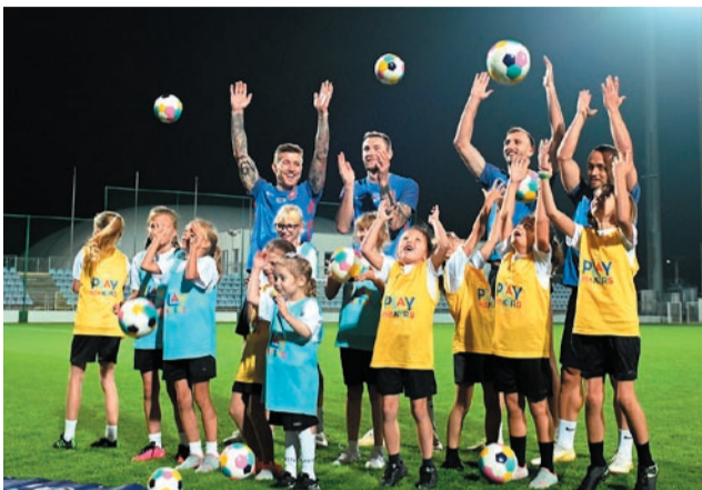
Projekt Disney playmakers a reprezentácia SR A-družstva.

a základnej školy a klubu a ich vzájomnú spoluprácu • nových fanúšikov všetkých vekových kategórií • nových trénerov a trénerky.