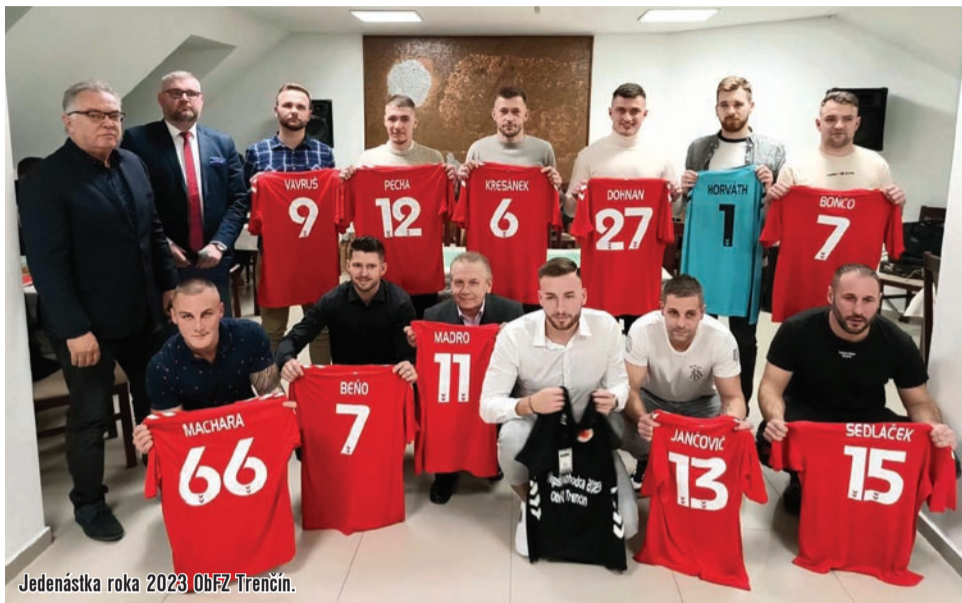
Jedenástka roka 2023 ObFZ Trenčín.