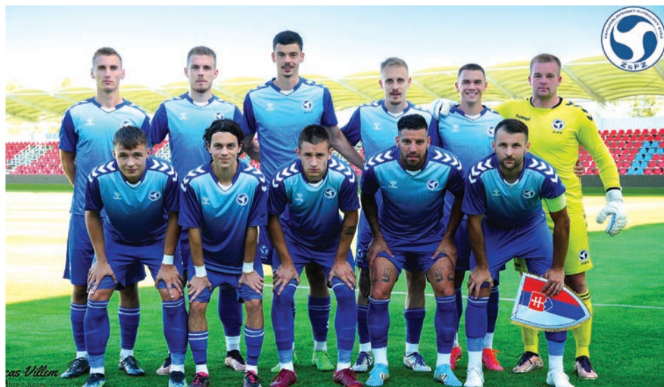
Mužský výber ZsFZ bude reprezentovať Slovensko na budúročnej kvalifikácii na ME amatérov.