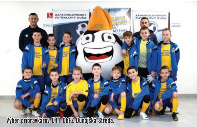
Výber pripravkárkov U11 ObFZ Dunajská Streda.