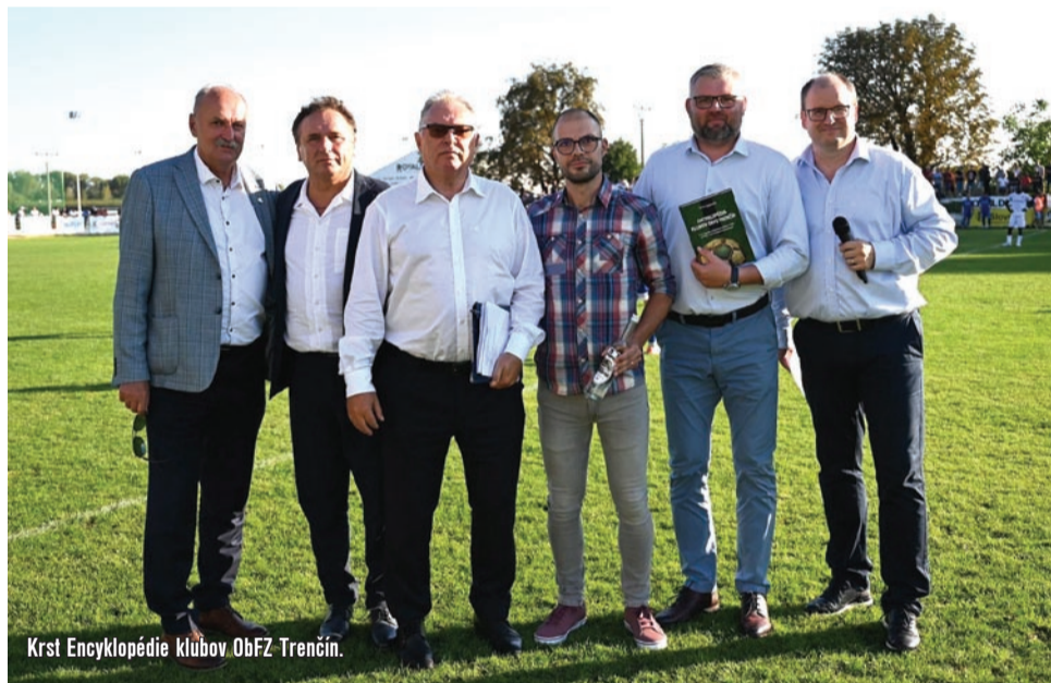
Krst Encyklopédie klubov ObFZ Trenčín.