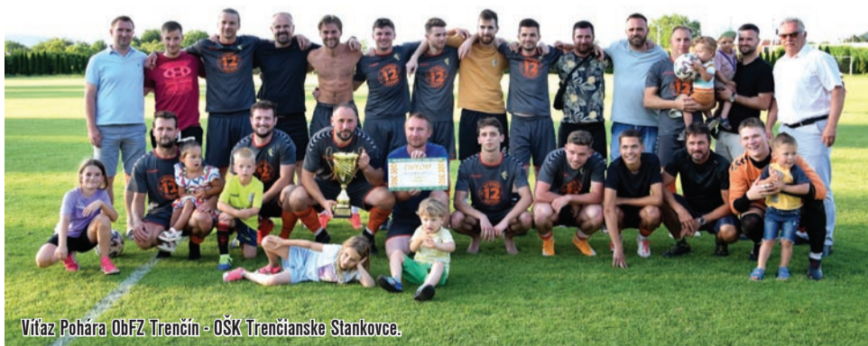
Víťaz Pohára ObFZ Trenčín - OŠK Trenčianske Stankovce.