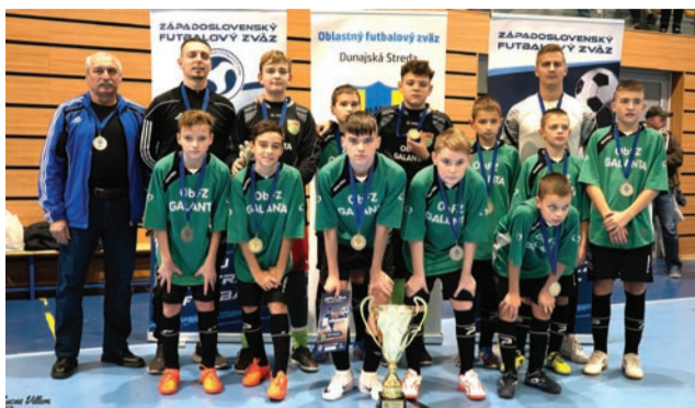
Oblastný mládežnícky výber ObFZ Galanta do 13 rokov potešil výkonomi na halovom turnaji o Pohár predsedu ZsFZ. V konkurencii 12 výberov získal striebro.