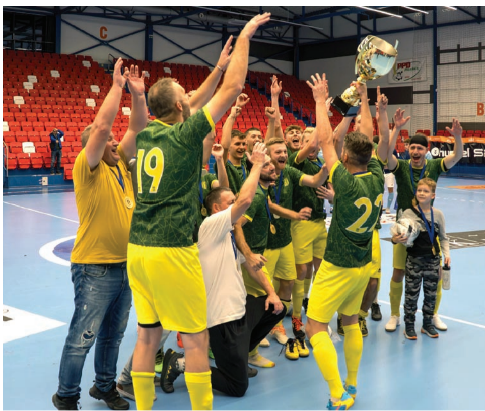
Prvý ročník mužského turnaja ZsFZ vyhrali Hronské Kľačany (jesenný majster VII. ligy ObFZ Levice).

„V podpore oblasťných futbalových zväzov sme našli spravodlivejšiu a motivačnú kľúču. Odráža sa od počtu mužstiev dospelých