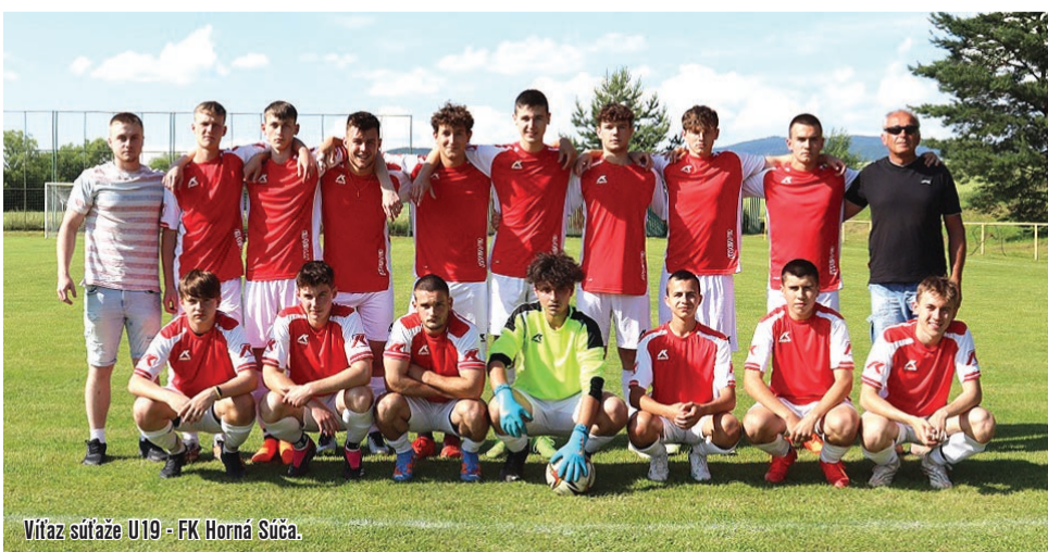
Víťaz súťaže U19 - FK Horná Súča.