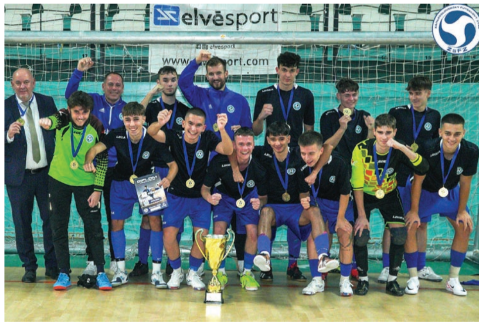
Mládežnícku halovú sezónu ZsFZ tromi titulmi ovládli výbery ObFZ Nitra. Na fotke víťazní starší dorastenci.

Zimná liga HUMMEL bude v druhom ročníku ešte väčšia, prihlásilo sa až štyridsať tímov. A to je evidentný dôkaz atraktivity