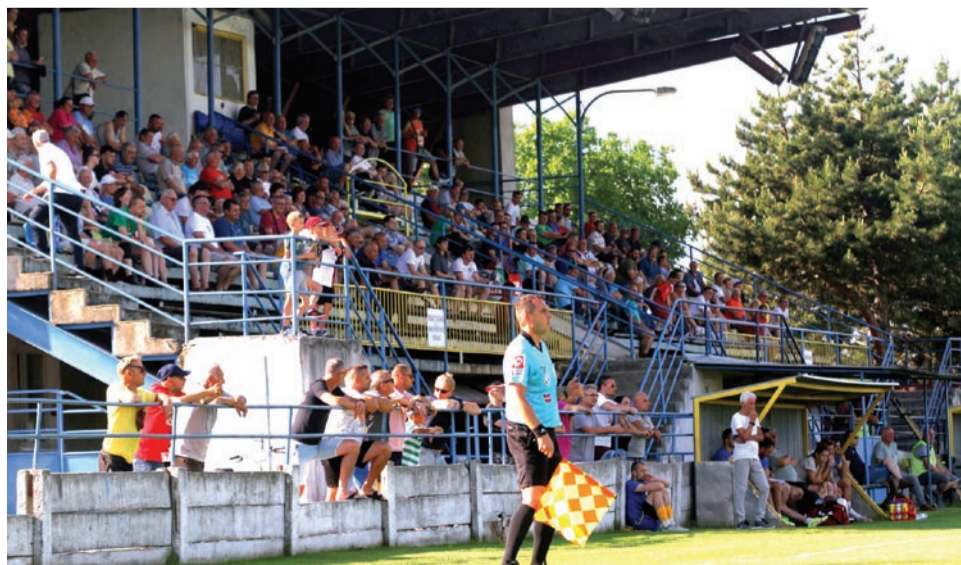
Až na 114 jesenných zápasov mužských súťaží ZsFZ prišlo dvesto a viac divákov.