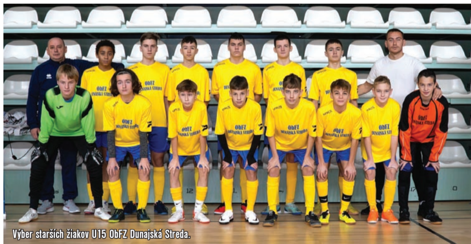
Výber starších žiakov U15 ObFZ Dunajská Streda.

že žiadne naše družstvo nemá problém so svojim štadiónom postúpiť do krajskej súťaže.“