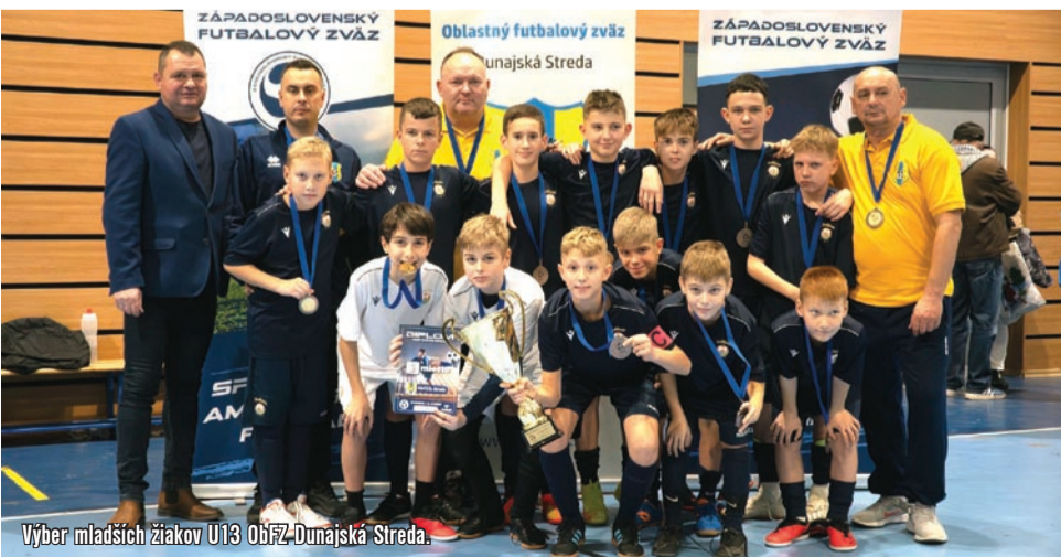
Výber mladších žiakov U13 ObFZ Dunajská Streda.