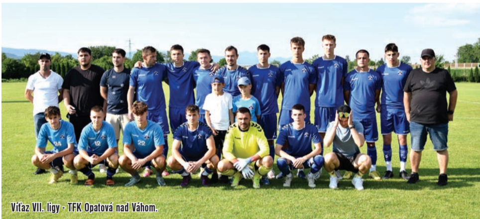
Víťaz VII. ligy - TFK Opatová nad Váhom.