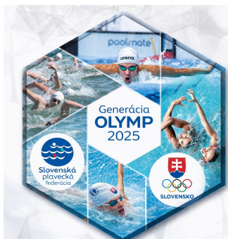
Nový projekt s SOŠV 275 tisíc Eur