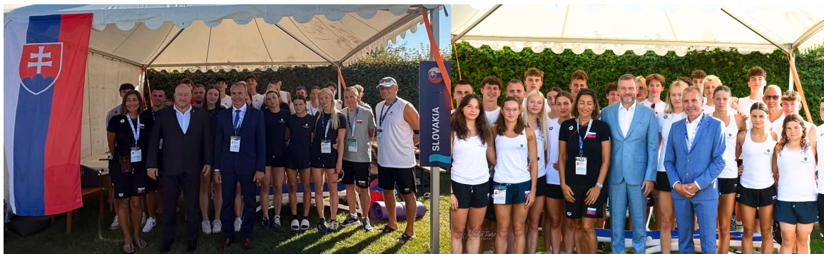
Návšteva ministra CRAŠ na MEU23