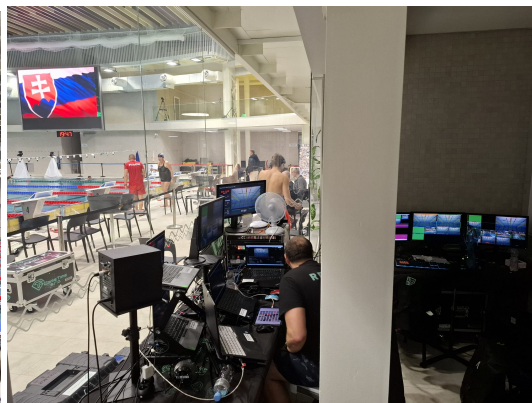
Nový partner Gametime – online prenosy