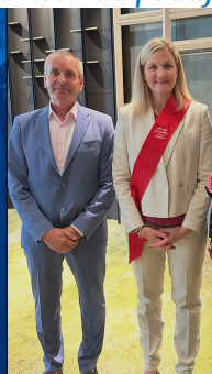
Nový prezident MOV Kirsty Coventry