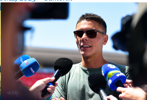
Domáca a zahraničná hviezda podujatia