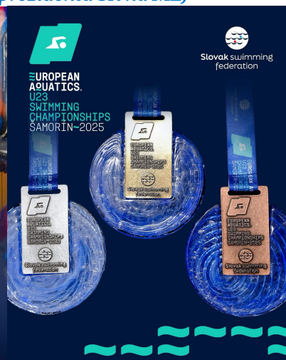
SPF – organizátor MEU23 a MEJ 2025 – Šamorín