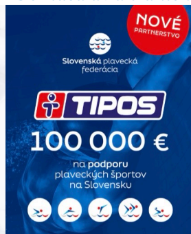
Nový partner SPF 100 tisíc Eur