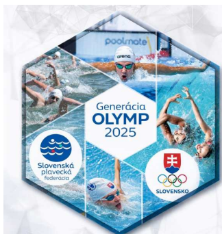
Nový projekt s SOŠV 275 tisíc Eur