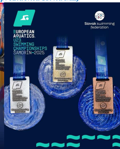
SPF – organizátor MEU23 a MEJ 2025 – Šamorín

DAVID POPOVICI LOWERS THE MEN'S 100M FREESTYLE EUROPEAN RECORD WITH A TIME OF 46.71