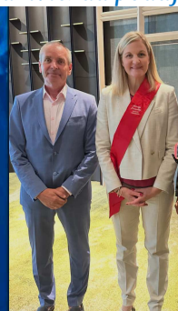
Nový prezident MOV Kirsty Coventry