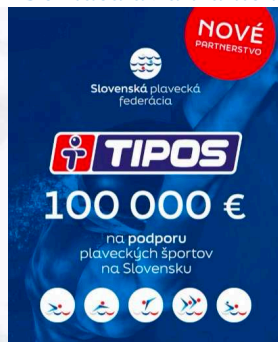
Nový partner SPF 100 tisíc Eur