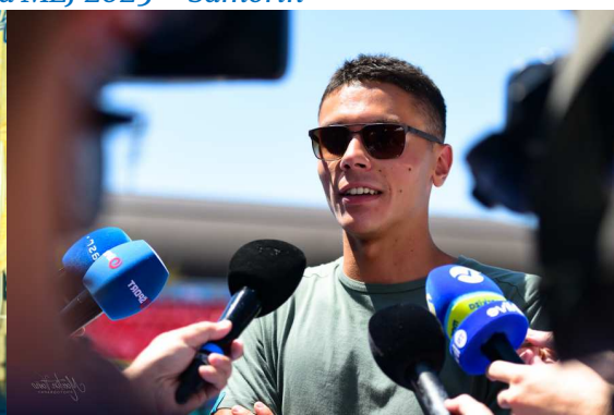
Domáca a zahraničná hviezda podujatia